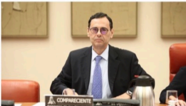
El gobernador del Banco de España, Jaime Caruana EP

El gobernador del Banco de España entre 2000 y 2006, Jaime Caruana, nombrado por José María Aznar, no cree que tenga que hacer demasiada autocrítica por el papel de la entidad supervisora en los años en los que se infló la burbuja inmobiliaria en España, la que dio la puntilla a la economía del país durante la crisis financiera internacional.